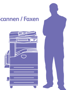
WorkCentre 5230 mit Zweibehälter-Modul