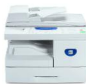
Kopieren | Drucken | Scannen | Faxen

Weitere Informationen erhalten Sie telefonisch unter 00 800 9000 9090 oder besuchen Sie uns im Internet unter www.xerox.com/office