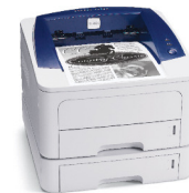
Abbildung: Phaser 3250 mit optionalem Fach 2