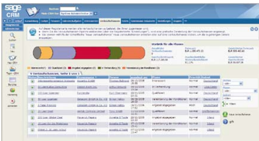
Analysieren und managen Sie Ihre Vertriebspipeline.